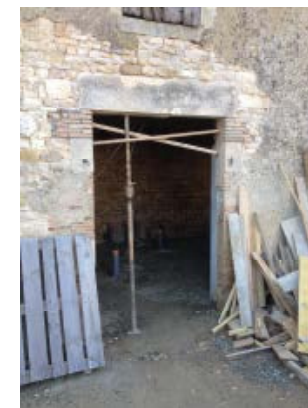
Rehausse du linteau de la porte principale