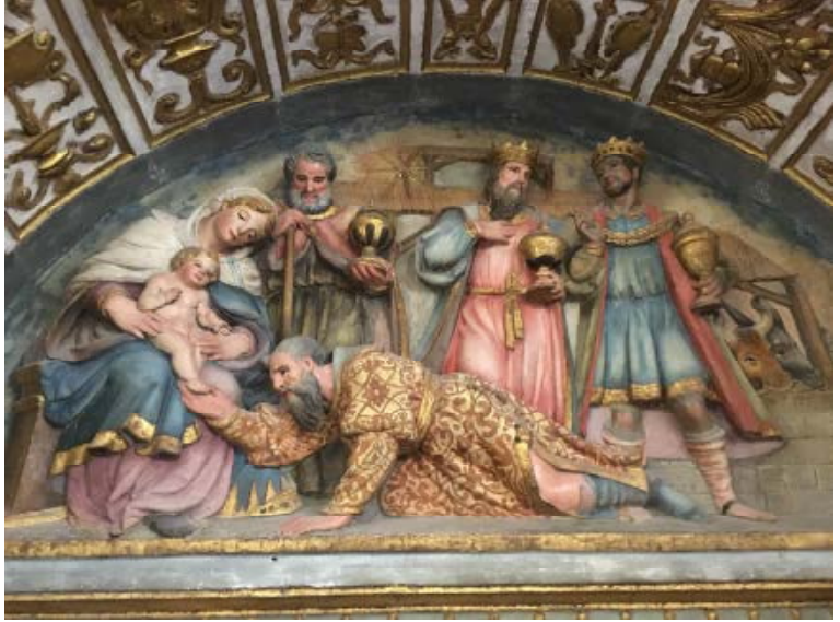
L'adoration des Mages le jour de l'Épiphanie

P OURQUOI avoir choisi le patronage de l'Épiphanie, pour notre école de Vendée ? Ce mystère renferme un riche enseignement concernant l'éducation chrétienne des enfants. En parallèle avec la devise de l'école — Accedite ad Eum , c'est-à-dire Allez à Jésus-Christ (Ps. 33) —, l'Épiphanie indique le but de toute l'éducation chrétienne : aider les enfants à aller à Jésus, reconnu comme leur Roi, Celui auquel ils apprennent à se