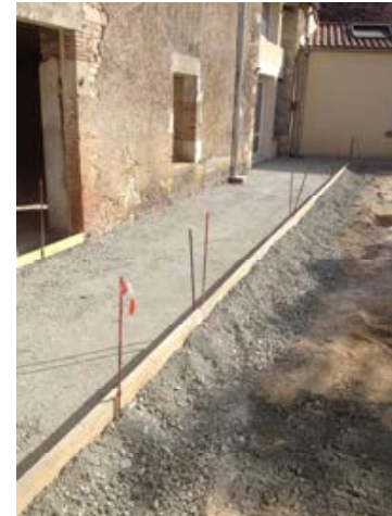
Réfection du trottoir devant la chapelle On aperçoit une partie des ouvertures sur lesquelles il faut poser les huisseries

Les travaux autour de la chapelle de l'école avancent lentement faute de ressources, mais cependant, grâce à vous, la dalle et le plancher d'étage sont coulés. Et prévoyant votre générosité, nous avons donc signé le devis des huisseries extérieures pour 17.545 €.