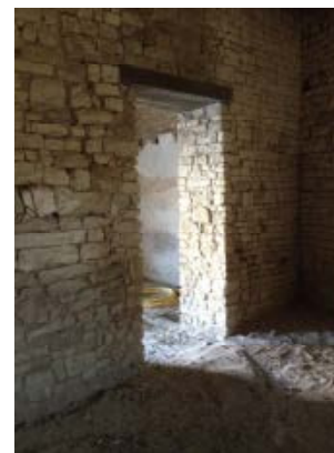
Ouverture d'une porte vers la chapelle