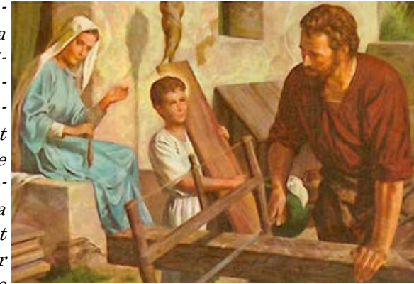
L'exemple du travail dans la Sainte Famille

Avoir le souvenir de la logique spirituelle de maman communiant souvent et excluant de sa vie la légèreté et la critique, c'est définitif pour une petite fille. »